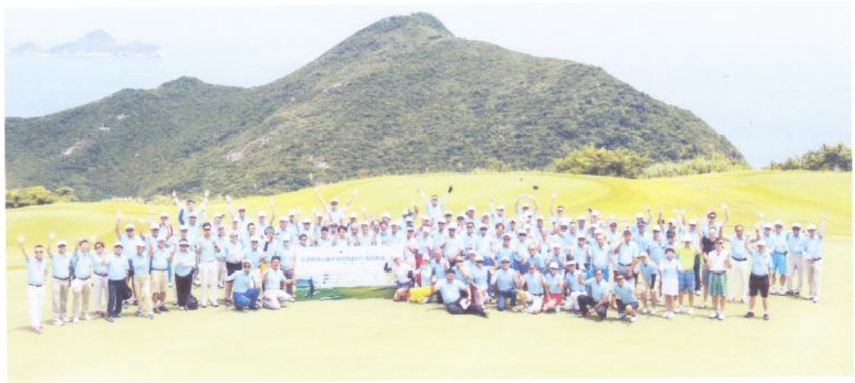
香港障健高爾夫球協會 2017 南方東英慈善賽 嘉賓及球友賽前大合照