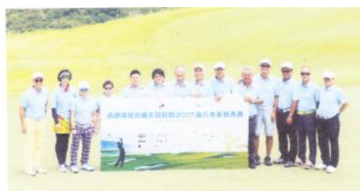
開球禮主禮嘉賓合照