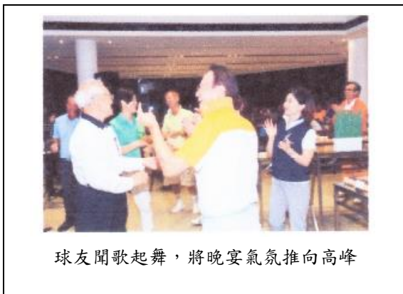
球友聞歌起舞，將晚宴氣氛推向高峰