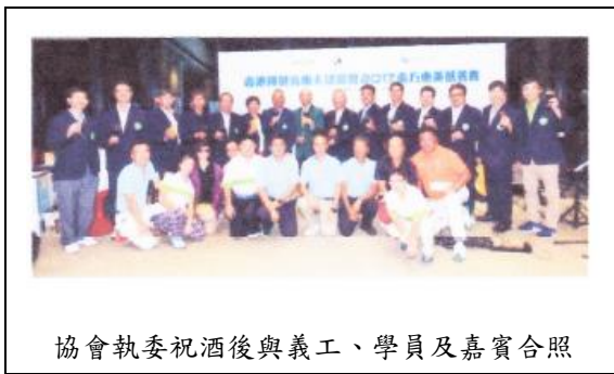
協會執委祝酒後與義工、學員及嘉賓合照