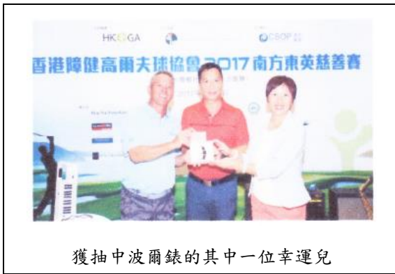
獲抽中波爾錶的其中一位幸運兒